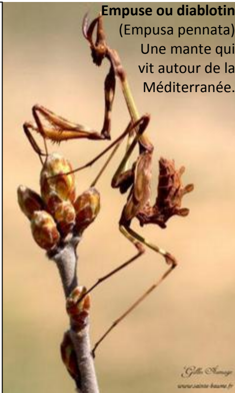
Empuse ou diabolotin

Le mensonge spectaculaire voyage plus vite qu'une vérité, même quand il est possible de le contredire, le mensonge a été tellement transmis qu'il continue de convaincre car une majorité continue de le répandre. Il est si facile d'affirmer c'est vrai et si dur de démontrer que c'est faux.