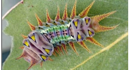
papillon Doratifera Oxleyi Australie