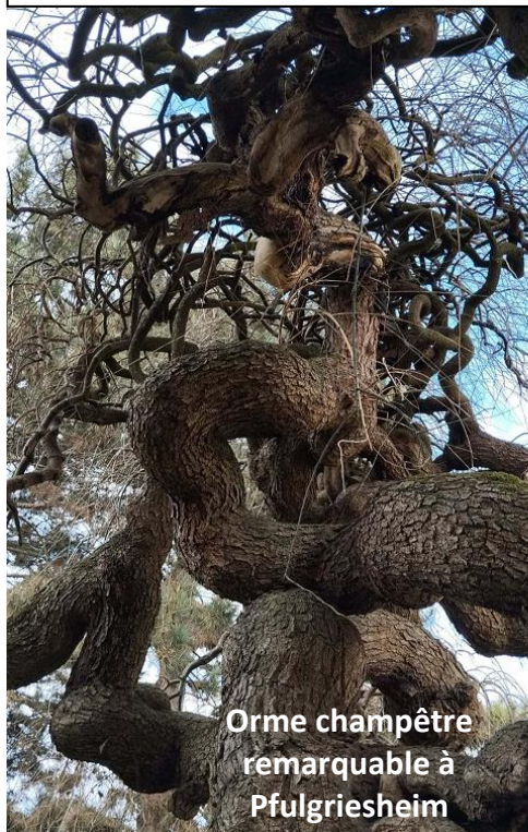
Orme champêtre remarquable à Pfulgriesheim