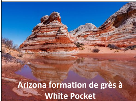
Arizona formation de grès à White Pocket

En Israël et à Dubaï, il est interdit de publier les images des dégâts causés par les missiles iraniens, et le nombre de morts américains dans toutes les bases et bâtiments U.S. ciblés n'est certainement pas que ces 4 décès officiellement admis par Trump. Mensonge est parole des guerres.