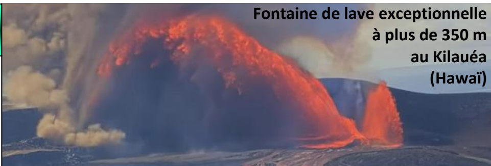
Fontaine de lave exceptionnelle à plus de 350 m au Kilauéa (Hawaï)

4,7 fois plus pour le Val de Loire que pour la Corse ?