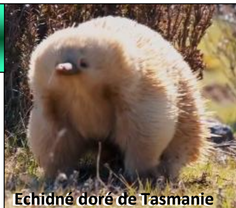
Echidné doré de Tasmanie

La délinquance touche les mâles, les jeunes, les personnes isolées, plus les pauvres, or comme les immigrés réunissent toutes ces caractéristiques ils sont logiquement plus représentés dans les prisons sans que la migration soit la cause réelle. Ce que refusent de voir tous les partis de droite