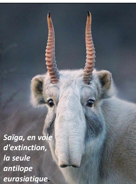
Saïga, en voie d'extinction, la seule antilope eurasiatique.

Et... bizarre... L'Etat souscrit pour 1 172 312 250 € l'augmentation de capital de la société anonyme Laboratoire français du fractionnement et des biotechnologies . Pourtant l'Etat avait déjà versé 320 millions à cette société en 2024 ! Cette société classée dans activité de sièges sociaux qui déclare 10 salariés a déjà fermé onze établissements (en reste 4) et perdait encore 116 M€ en 2020 !