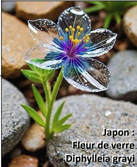
Japon : Fleur de verre Diphylleia grayi

Faut dire que « les citoyens revendiquent des changements pacifiques, et des élections honnêtes et transparentes » que de gros mots dans une même phrase, voyons !