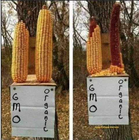
Les écureuils ont bien remarqué la différence, mais nous pas...

Le Rassemblement national a décidé de baptiser 'Marie Curie' son plan de relance nucléaire. En même temps le RN veut interdire l'acquisition de la nationalité par le mariage. Ils ont juste oublié que Marie Skłodowska-Curie fut naturalisée française par son mariage avec le physicien Pierre Curie en 1895. Ah ce manque de culture qui se trahit lui-même !