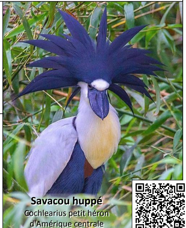
Savacou huppé Cochlearius petit héron d'Amérique centrale

Pour comprendre Le code de la sécurité intérieure il faut du courage : Je vois passer au journal officiel un décret le modifiant : [Ces traitements] ne sont pas soumis aux pouvoirs de contrôle de la Commission nationale de l'informatique et des libertés. Il est quasiment impossible de retrouver ce que ce code précisait avant, voilà encore une petite touche discrète que nos libertés et tous les contrôles sur ceux qui la gèrent nous sont retirés au nom de la sécurité. Barreaux après barreaux la cage se referme, le prochain président aura tous les moyens juridiques pour imposer sa dictature.