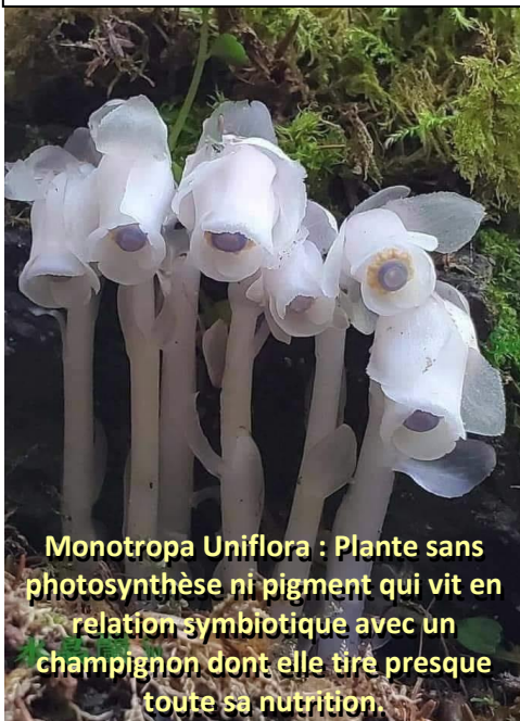
Monotropa Uniflora : Plante sans photosynthèse ni pigment qui vit en relation symbiotique avec un champignon dont elle tire presque toute sa nutrition.

A la rigueur si elle n'est pas commerciale, mais surtout pas aux scientifiques, surtout quand ils travaillent pour l'armée : Quand Oppenheimer a fait sauter la toute première bombe nucléaire, il ignorait si la réaction en chaîne n'allait pas continuer et détruire toute la terre. Pourtant il l'a fait quand même. Donc si un scientifique a déjà pu décider d'un tel risque sans qu'il soit inquiet, combien d'autres sont en train de jouer notre avenir en ce moment ?