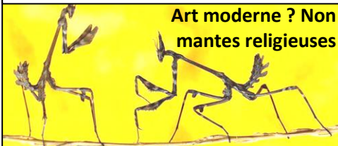
Art moderne ? Non mantes religieuses

Marseille est à la 68 ème place des villes du monde pour ce début de 2022, 3 ème ville d'Europe, 1 er rang en France avant Nantes ! Mais pas de quoi être fier, car c'est seulement selon l'indice de criminalité.