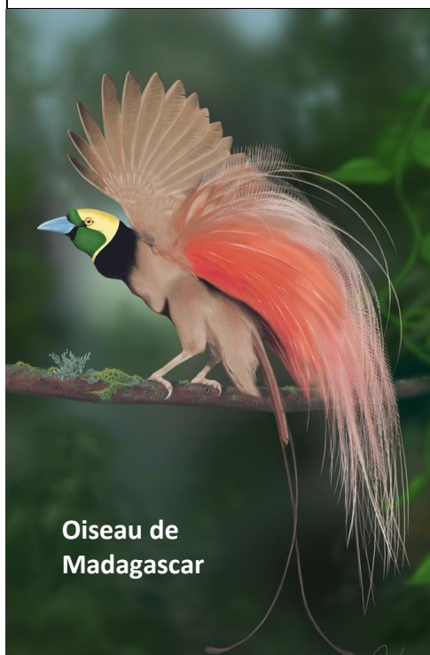
Oiseau de Madagascar

La gestion de Gaudin a remporté un maximum des records : Celui de la pollution, des embouteillages, de la pauvreté, des dégradations immobilières, de la vétusté des écoles, des fermetures de piscines, de destructions de parcs et jardins, de manque de terrains de sports, de coût du tramway au km, du manque de transports en communs, des trafics de drogues et de règlements de comptes, etc. et tout cela avec le plus beau des records: Le niveau d'endettement ! Faut le faire ! Et même l'opposition est en train de battre le record des divisions !