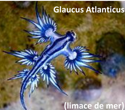
(limace de mer)