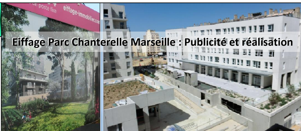
Eiffage Parc Chanterelle Marseille : Publicité et réalisation

Oublie ce que tu donnes Souviens-toi de ce que tu reçois.