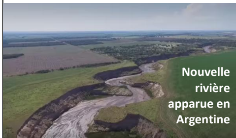
Nouvelle rivière apparue en Argentine

Ils ont tant détruit les forêts en Argentine pour planter du soja sur 2.4 millions d'hectares (4 % de la surface de la France !), que la nature se révolte, faute d'arbres pour absorber les pluies, l'eau coule et invente de nouvelles rivières, de profonds ravins parfois creusés en une nuit : 25km de long, 60m de large et 25m de profondeur ! Ces rivières érodent très vite les terres défrichées et submergent routes et champs en aval. Alors l'état commence trop tard à comprendre. Mais soyez rassurés, ne vous inquiétez pas pour les investisseurs, ils ont trouvé la parade : Maintenant ils louent les terres aux propriétaires terriens et changent de lieu quand la terre est devenu inutilisable !