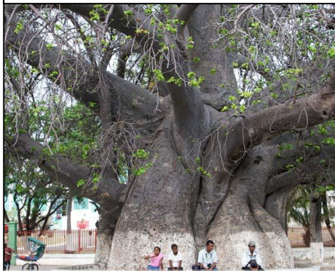
Malgré sa taille, disparition prochaine du baobab « Andansonia Perrieri »...

Le paumé déséquilibré qui tue est moins coupable que la grande gueule qui l'a poussé à cette extrémité, mais qui sera détruit ?