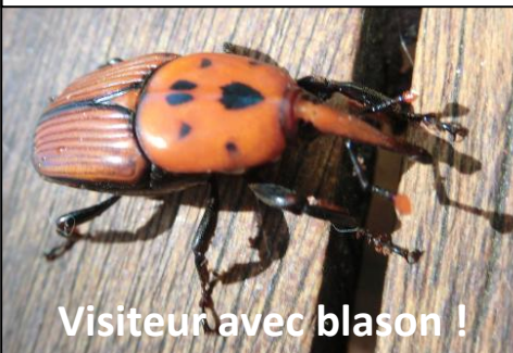
Visiteur avec blason !