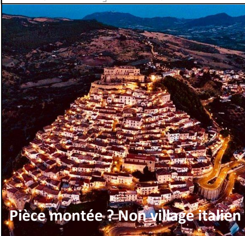
Pièce montée ? Non village italien