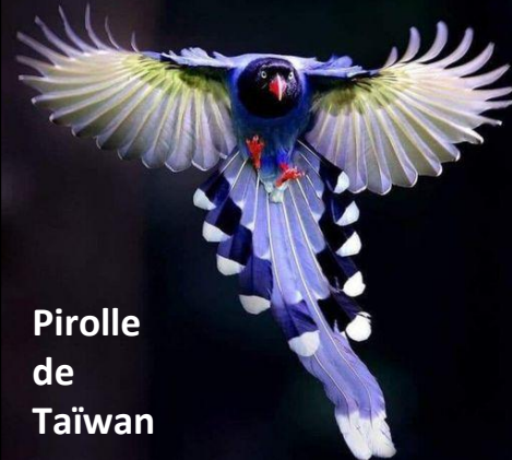
Pirolle de Taïwan