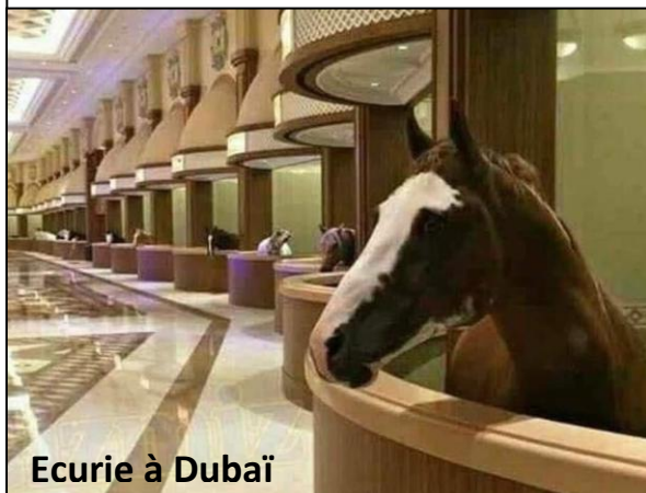
Ecurie à Dubaï

En Chine une intelligence artificielle est testée pour juger les citoyens et décider des peines à la place d'un procureur. Chez nous déjà nous avons toléré la verbalisation des véhicules mal stationnés par des machines, alors pourquoi ne jugeraient-ils pas de même les citoyens ? Dieu a été nommé parfois le grand ordinateur , aujourd'hui comme lui, l'ordinateur est devenu omniprésent, omniscient, juge, tout puissant, éternel (un fichier ne s'use jamais). Et n'oubliez pas pouvoir l'arrêter, il contrôle même par biométrie qui a accès aux serveurs et ses sources d'énergie sont de plus en plus autonome.