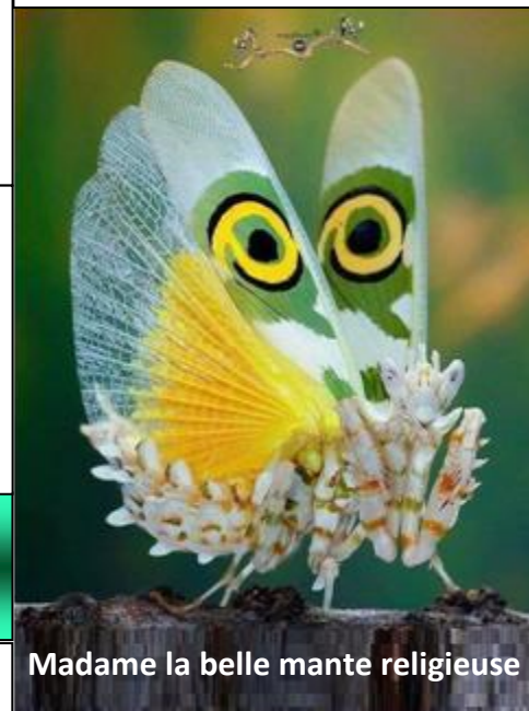
Madame la belle mante religieuse

Macron réindustrialise ! Decazeville, 333 salariés virés.