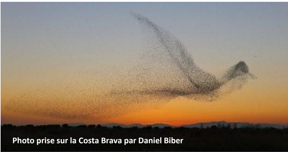
Photo prise sur la Costa Brava