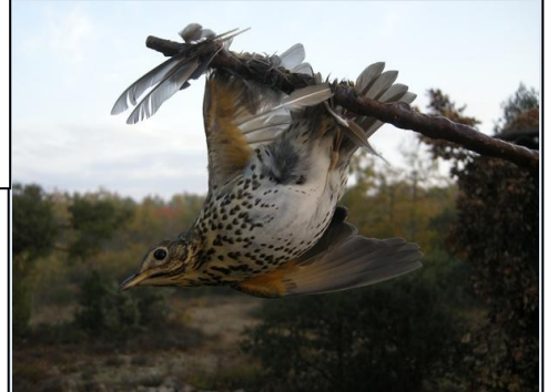
Grive musicienne engluée....

Alors que les populations d'oiseaux chutent de façon alarmante et que 84% des Français rejettent le piégeage des oiseaux à la glu, avec des filets, et autres pièges ne permettant pas de distinction entre les espèces, mais le gouvernement censé représenter les citoyens refuse de l'interdire.